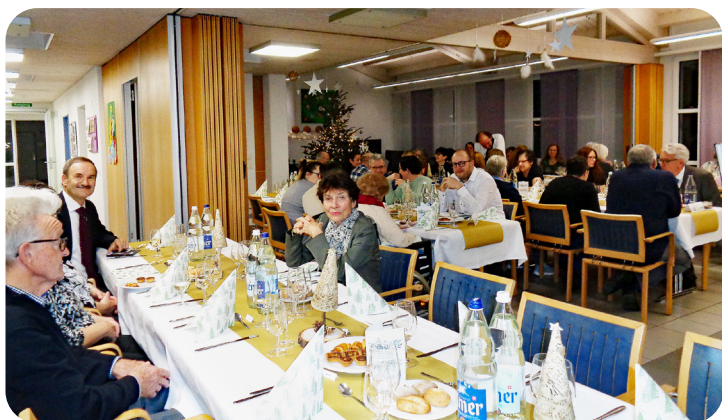
Weihnachtsessen in Dottikon

Auch im Wohnen an der Bünz wurde am Dienstag, 19. Dezember 2023 ein Weihnachtsessen mit Bewohner/innen und Angehörigen gefeiert. Dort wurde der Anlass von der Bläsergruppe Dottikon feierlich umrahmt.