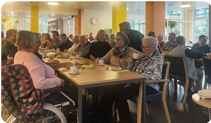
Angehörigen Treff in der Oberen Mühle Villmergen

Traditionell wurden die Teilnehmerinnen und Teilnehmer mit Heissgetränken und Gipfeli verköstigt, während sie die aktuellen Neuigkeiten rund um die Obere Mühle Villmergen und das Wohnen an der Bünz präsentiert bekamen.