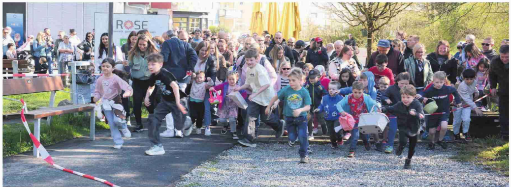
Achtung, fertig, los: Es geht doch eigentlich nur um Eier, und dennoch ist der Jagdtrieb bei den Kindern riesig.

zur Ostereisuche in den Sinnespark – der Event ist Teil der Strategie, sich mehr zu öffnen und Leben ins Alterszentrum zu bringen. «Auch unsere Bewohner haben Freude daran. Sie beobachten gerne, wie die Kinder sich auf