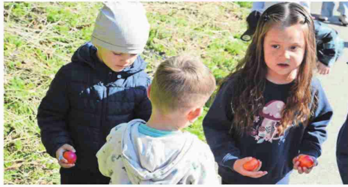
Wie viele hast du schon gefunden? Die meisten Teilnehmer waren fair und achteten darauf, dass am Schluss alle ein Ei hatten.