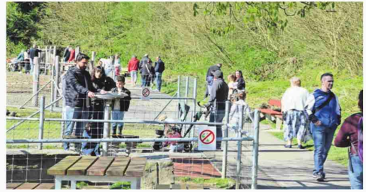
Der Sinnespark war auch gut besucht an diesem Tag, viele nutzten die Gelegenheit, das schöne Wetter trug viel dazu bei.