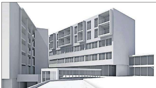
Eine erste Visualisierung: Der frühere Haupteingang verändert mit dem neuen Annexbau (rechts) sein Gesicht komplex. Eine Passerelle führt zum geplanten Mehrfamilienhaus.

Die «Erweiterung OMV 2030» wird im Rahmen einer Gesamtanbauplanung mit der Überbauung «Oberdorf» der Xaver Meyer AG ausgelegt und sieht