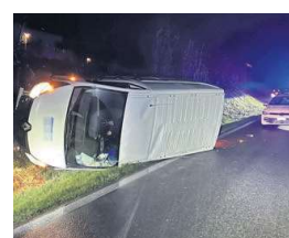
Das Auto des Unfallverursachers kippte auf einer Böschung zur Seite, der Fahrer blieb unverletzt.

Der Unfall ereignete sich am Mittwoch, 11. März, kurz nach 23 Uhr auf der Farnstrasse in Villmergen. Auf dieser Hauptstrasse war der Lenker eines Renault-Lieferwagens in Richtung Wohnen unterwegs. Wie er später der Kantonspolizei erklärte, habe er nach